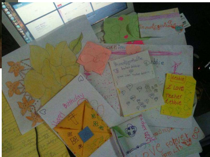
女兒送給我的生日禮物